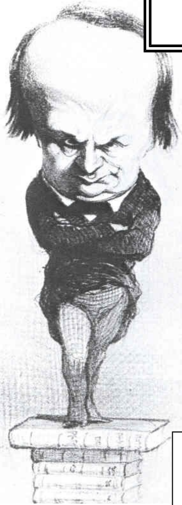
Caricature de Victor Hugo par Honoré Daumier