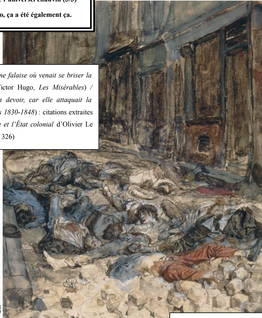
Jean-Louis-Ernest Meissonier, La Barricade , 1848